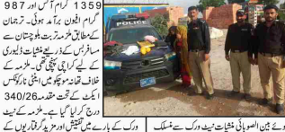
کراچی (ایف ڈی اے) پولیس نے ایک کامیاب کارروائی کی ہے۔ پولیس نے ایک شخص کو گرفتار کیا ہے۔

کراچی میں پولیس نے ایک کامیاب کارروائی کی ہے۔ پولیس نے ایک شخص کو گرفتار کیا ہے۔