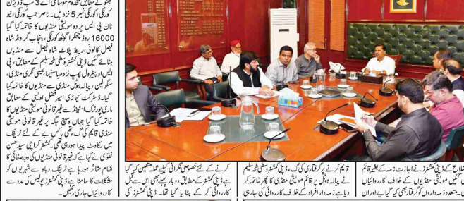
کراچی (ایف ڈی اے) ایک میٹنگ ہو رہی ہے جس میں پولیس اور ایف ڈی اے کے افسران نے امور متعلقہ پر تبادلہ خیال کیا ہے۔