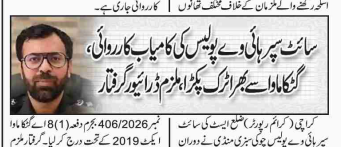
کراچی (ایف ڈی اے) پولیس نے ایک کامیاب کارروائی کی ہے۔ پولیس نے ایک شخص کو گرفتار کیا ہے۔