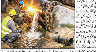
کراچی (ایف ڈی اے) ایک نیا پانی کی لائن کی تعمیر ہو رہی ہے۔ اس کے تحت کئی گھنٹوں کی ٹریفک رکاوٹ ہو رہی ہے۔

ڈسٹرکٹ سینیٹر نے پولیس کی کارروائیوں پر فخر کا اظہار کیا ہے۔ انہوں نے پولیس کو مبارکباد دی ہے۔