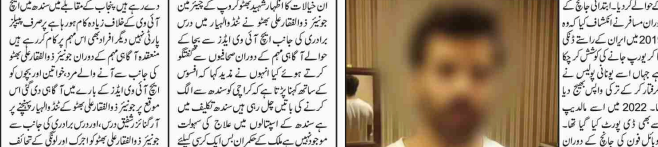
کراچی (ایف ڈی اے) پولیس نے ایک کامیاب کارروائی کی ہے۔ پولیس نے ایک شخص کو گرفتار کیا ہے۔