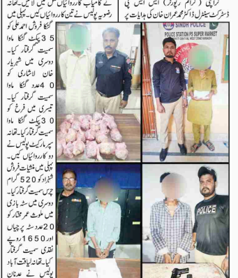
کراچی (ایف ڈی اے) ڈسٹرکٹ سینیٹر نے پولیس کی کارروائیوں پر فخر کا اظہار کیا ہے۔