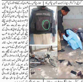
کراچی (کریم رپورٹر) پولیس نے ملزمان کو گرفتار کیا اور ایک بلٹ پروف جیکٹ سے باعث محفوظ رہا۔