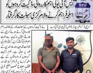
کراچی (کریم رپورٹر) ایس ایس پی یو ای ایم کارروائی کی اور ڈیکٹ گروہ کو اسٹیج روہ کرنے والا مرکزی ہیلوٹ کار گرفتار کیا گیا۔