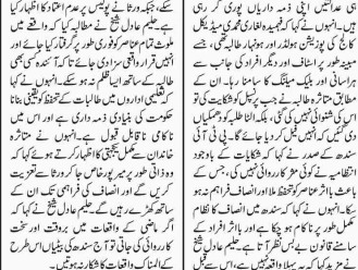
کراچی (کریم رپورٹر) ایس ایس پی یو ای ایم کارروائی کی اور ڈیکٹ گروہ کو اسٹیج روہ کرنے والا مرکزی ہیلوٹ کار گرفتار کیا گیا۔