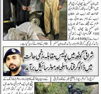
کراچی (کریم رپورٹر) شرافی گھوٹ میں پولیس مقابلہ ہوا اور ڈاکو گرفتار کیا گیا۔