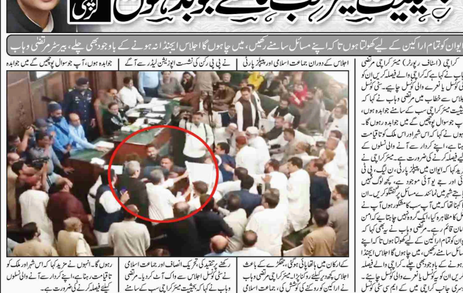
کراچی (ایف پی) بستی کونسل اجلاس میں جماعت اسلامی اور پیپلز پارٹی کے ارکان میں ہاتھ پائی کی صورتحال برقرار ہے۔