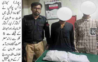
کراچی (کریم رپورٹر) ڈاکو پولیس کی کارروائی کی اور 2 ملزمان گرفتار کیے گئے۔