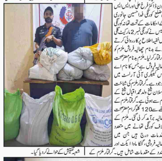
کراچی (کریم رپورٹر) ڈی آئی بی ایسٹ علاقہ محضرت درج کے علاقے میں لوٹی گریپس کی کامیاب کارروائی ہوئی۔