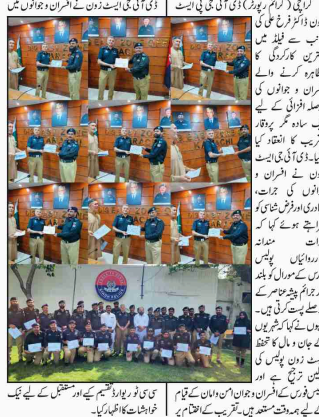
کراچی (کریم رپورٹر) ڈی آئی بی ایسٹ زون کے افسران و جوانوں میں سی ای او ایوارڈ کی تقسیم کی تقریب منعقد ہوئی۔