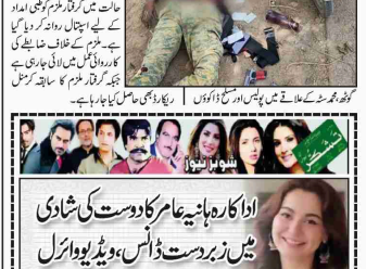
اداکارہ ہانیہ عامر کی ویسٹ کی شادی میں زبردست ڈانس ویڈیو وائرل ہوئی۔