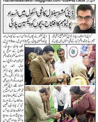
کراچی (ایف پی) ڈی آئی بی کسٹمر سٹیزل اسکول میں انسداد پولیوہم کا افتتاح کیا گیا۔