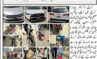
کراچی (کریم رپورٹر) بغیر نمبر پلٹ والی گاڑیوں کے خلاف اسٹیپ چیکنگ جاری ہے۔