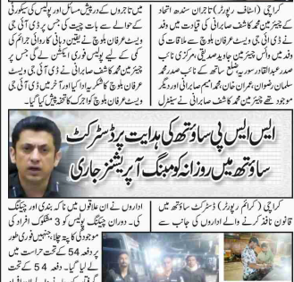
کراچی (کریم رپورٹر) آل تاجران سندھ اتحاد کے وفد کی ڈی جی ویسٹ عرفان بلوچ سے ملاقات ہوئی۔