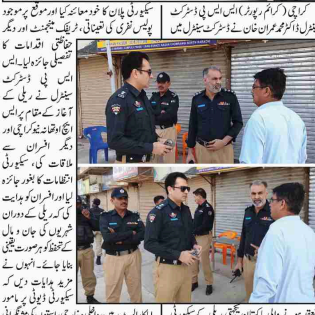
کراچی (کریم رپورٹر) ایس ایس پی ڈسٹرکٹ نیپزل ڈاکٹر عمران خان نے پاکستان منتقلی کے سیکورٹی انتظامات کا جائزہ لیا۔