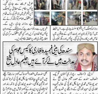
کراچی (کریم رپورٹر) ڈسٹرکٹ ساواتھ میں روزانہ ویکنگ آپریشنز جاری ہیں۔