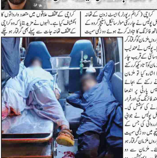
کراچی (کریم رپورٹر) جنگل پولیس نے موٹرسائیکل اسٹیج روہ سے فانگ کیا اور 4 ملزمان گرفتار کیے۔